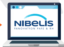
LA SOLUTION NIBELIS